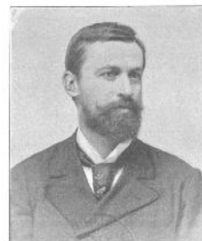
Dr. Maximilian Fabiani